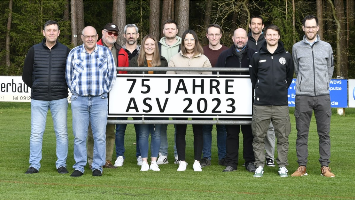
Die Verwaltung des Vereins nach den Neuwahlen im März

Mit sportlichen Grüßen im Namen der Vorstandschaft Euer