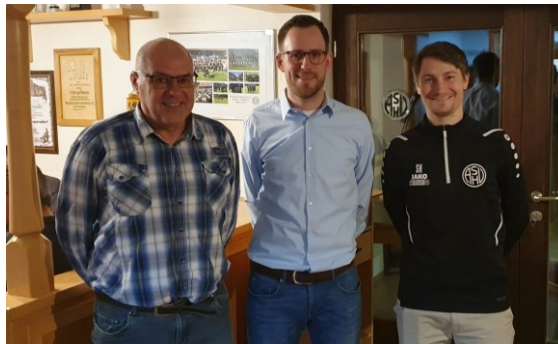
Die aktuelle Vorstandschaft des Vereins