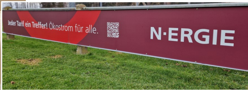
Neu an der Bande – Der Energieversorger N-ERGIE

Der ASV Herpersdorf freut sich den Stromversorger N-ERGIE seit Kurzem als Werbepartner für den Verein gewonnen zu haben. Wir sagen Danke für die Unterstützung und begrüßen Euch an unserer Bande.