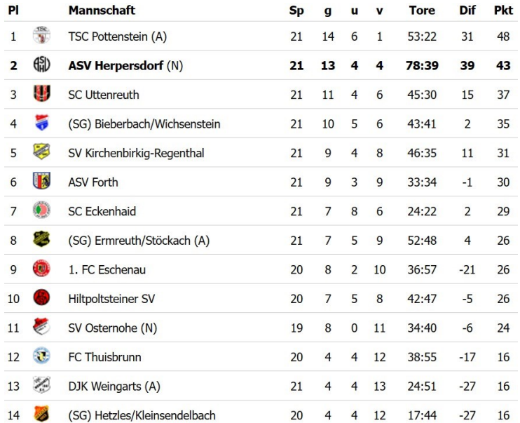
Tabelle Stand 06.05.2023

Die erste Mannschaft des ASV startete Perfekt ins Jahr 2023. Nachdem es vor Beginn der Winterpause recht holprig lief, konnte man aus den ersten fünf Pflichtspielen im Jahr 2023 fünf Siege holen und steht damit weiter auf Platz 2 der Tabelle.